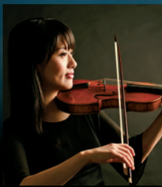
【客員コンサートミストレス】 大内山薫